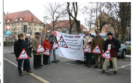
Aktion in Eisenach zur Klausurtagung von SPD-Fraktion des Berliner Abgeordnetenhauses

Die Aktion in Eisenach sollte auf diese laufenden Diskussionen in Berlin aufmerksam machen und die SPD auffordern, ihre Bedenken gegen die Rückführung der Wasserbetriebe in öffentliches Eigentum zurück zu stellen. Parallelen gibt es im Übrigen auch in Thüringen. Bei mehreren Zweck-