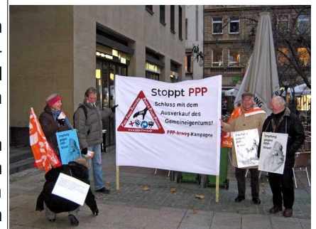
Aktion in Frankfurt/Main gegen PPP