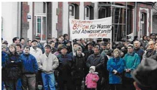
Etwa 800 BürgerInnen demonstrierten am 22.03.1997

Die Forderung damals war, und dabei stützte man sich auf eine Äußerung von Ministerpräsident Bernhard Vogel, dass die Gebühren für Wasser und Abwasser nicht mehr als 8,80 DM pro Kubikmeter betragen dürfen und die Beiträge maximal 7.000 DM erreichen dürfen.