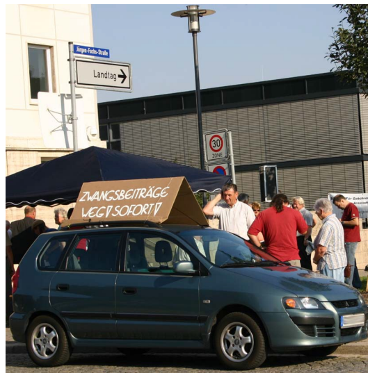
Autokorso für Gebührengerechtigkeit und Abschaffung von Beiträgen vom Thüringer Landtag im Sommer 2009

Die Gewinnausschüttung hat jedoch auch steuerrechtliche Konsequenzen. Neben der Kapitalertragssteuer